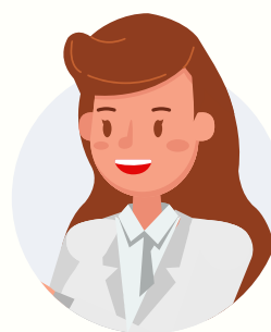
Regio- of locatiemanager