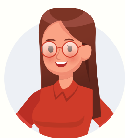
Directe collega-zorgbegeleiders uit zelfsturend team